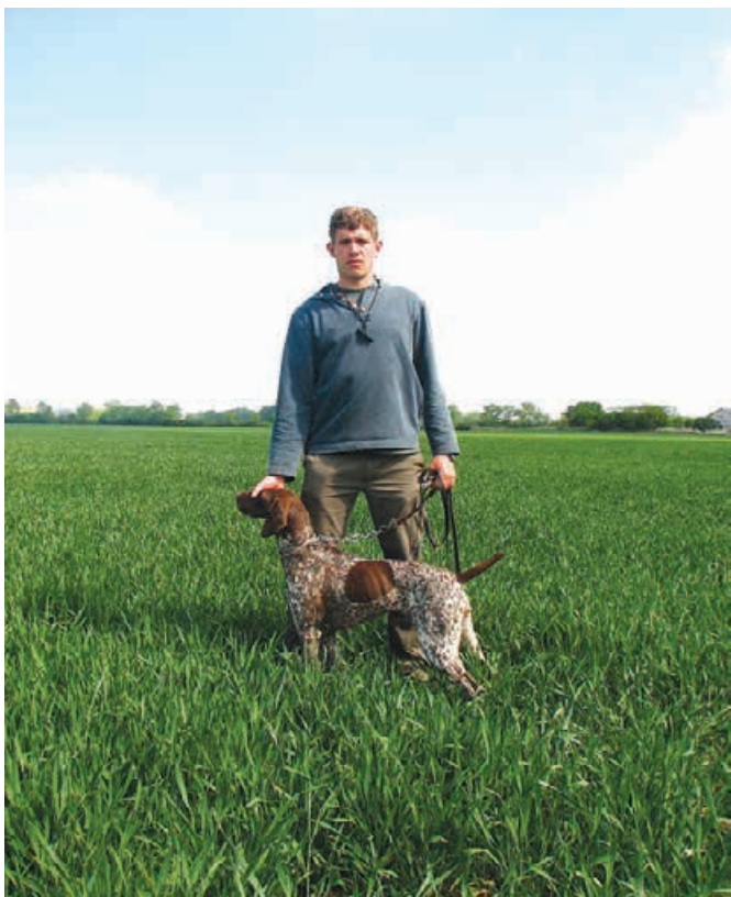
JSV - 2017