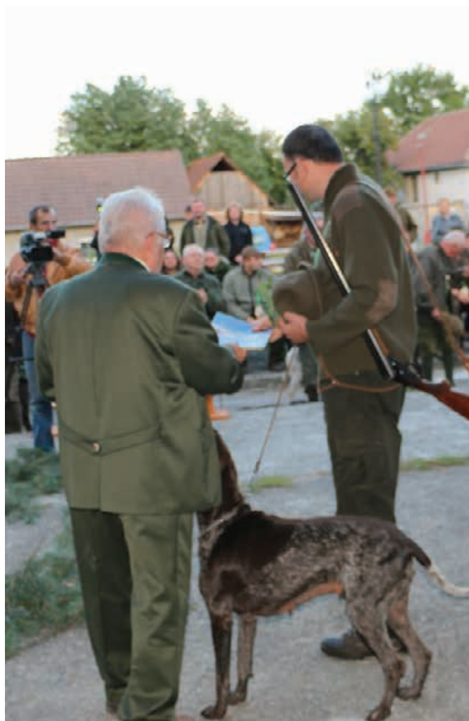
2015 - MKS - Borský Mikuláš