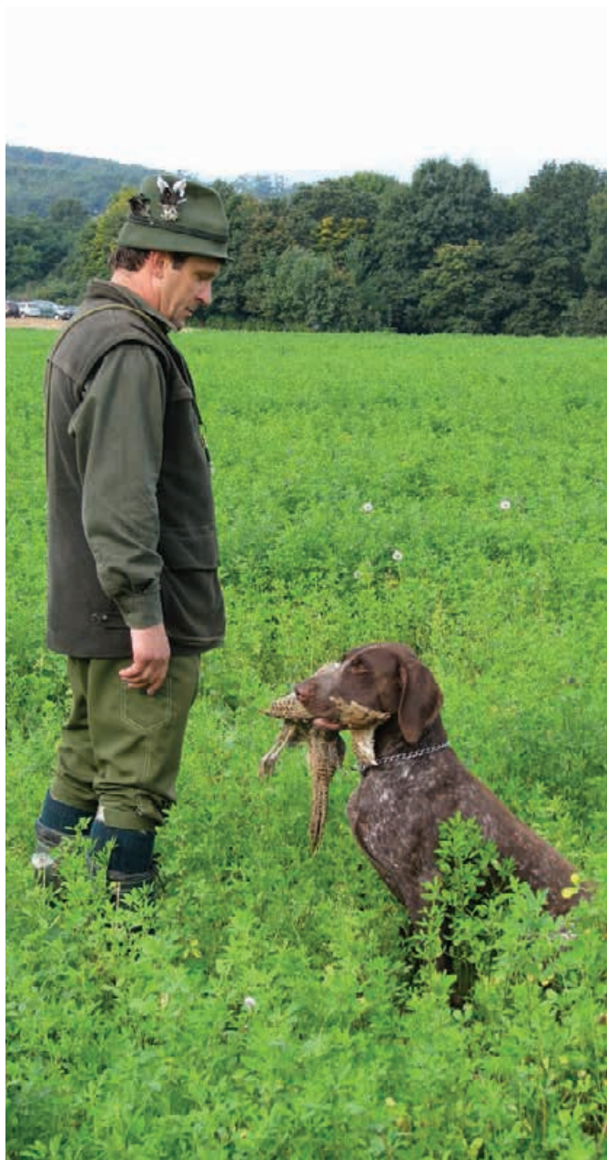
2010 - MKS - Dolná Krupá