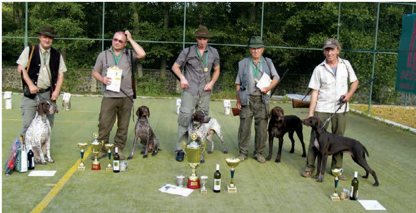
2012 - MJK Dargov