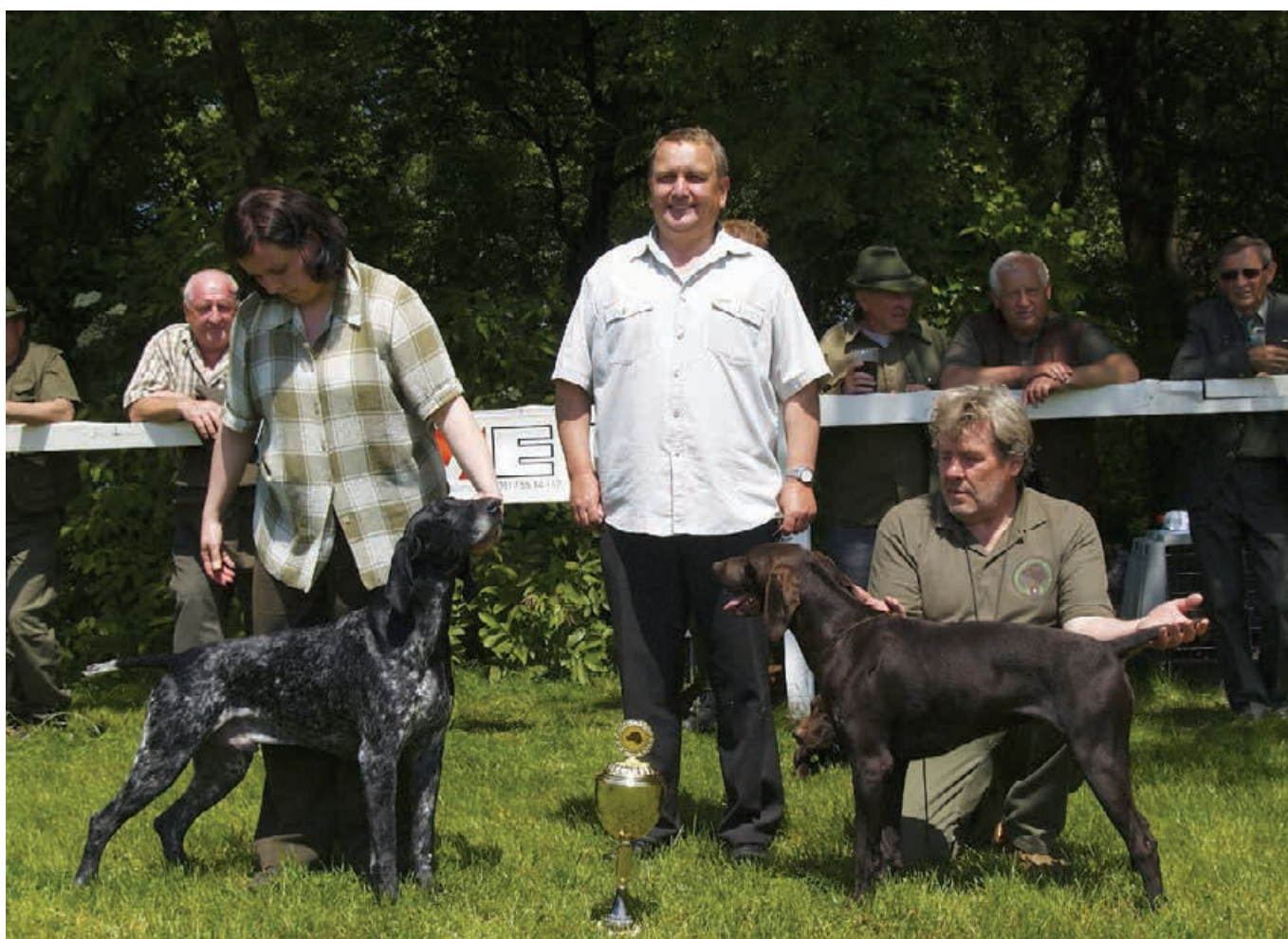
KV 2010 - Basty zo Šurianskeho kopca