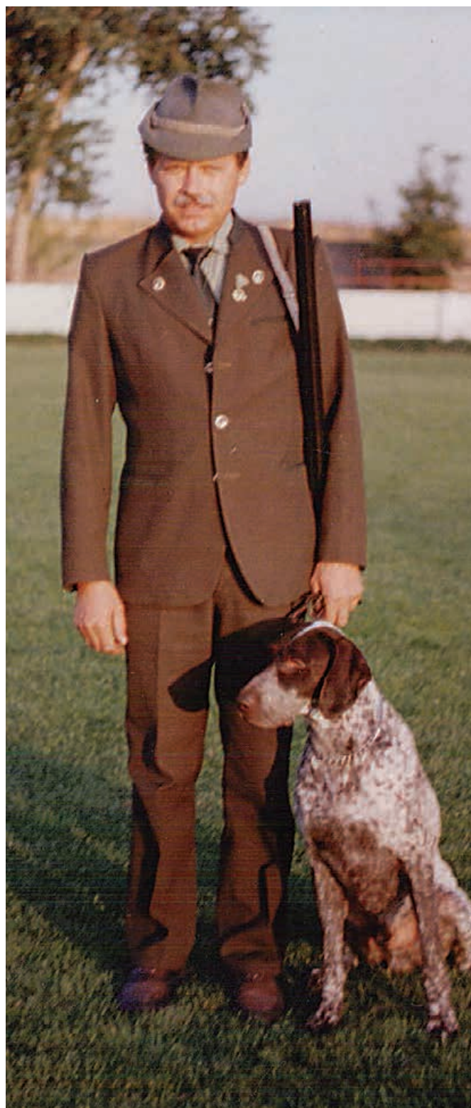
Brok z Polánky

1979 – Ivo z Jihočeských lesů NKS 1981 – Ivan z Nezvalova kraje NKS 1983 – Ibis z Bilice NKS 1986 – Gron z Drátaře NKS 1992 – Brok z Polánky NKS