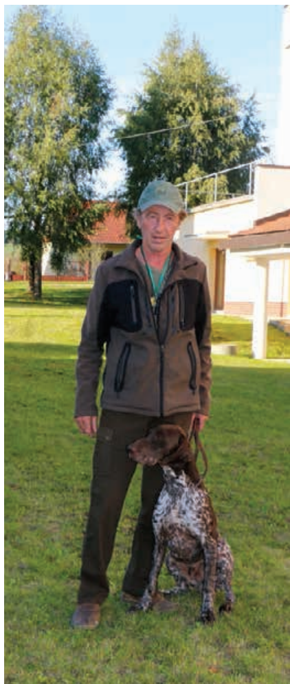
2014 Vido z Bilice, v. L. Banás st.