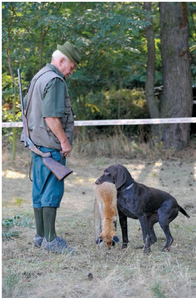
2008 - MJK Moravský Sv. Ján

História MJK je stará 71 rokov . Na pomyselnom piedestáli víťazov sa vystriedalo veľa vodičov s NKS . Všetkým je potrebné pográtulovať k úspechu a poďakovať za ich prácu v prospech nášho obľúbeného plemena. Každé víťazstvo na týchto vrcholových podujatiach zvyšuje prestíž plemena a NKS zvíťazili toľkokrát na tejto súťaži okrem iného i preto, že ich vodili a vodia špičkoví vodiči.