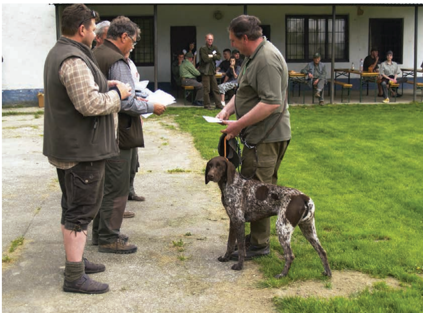
JSV - 2011