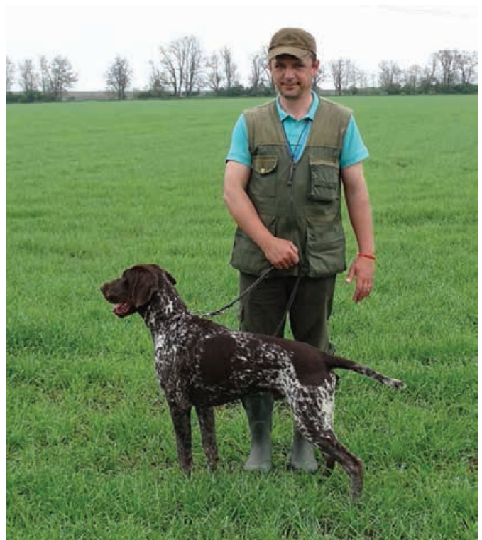
JSV - 2015