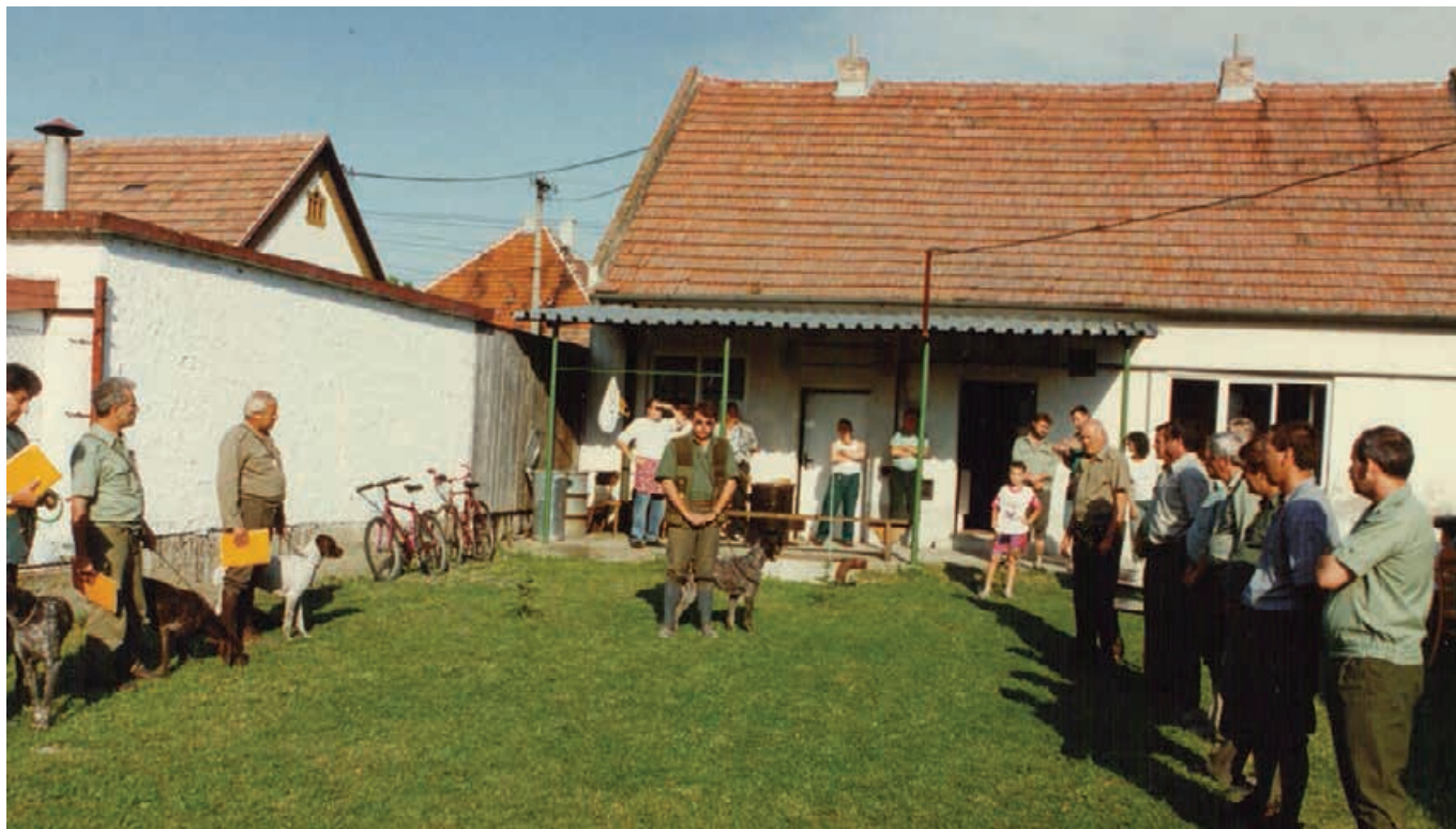
CHS NKS 1997