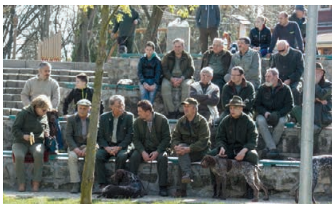
Jarný zvod NKS - 2015