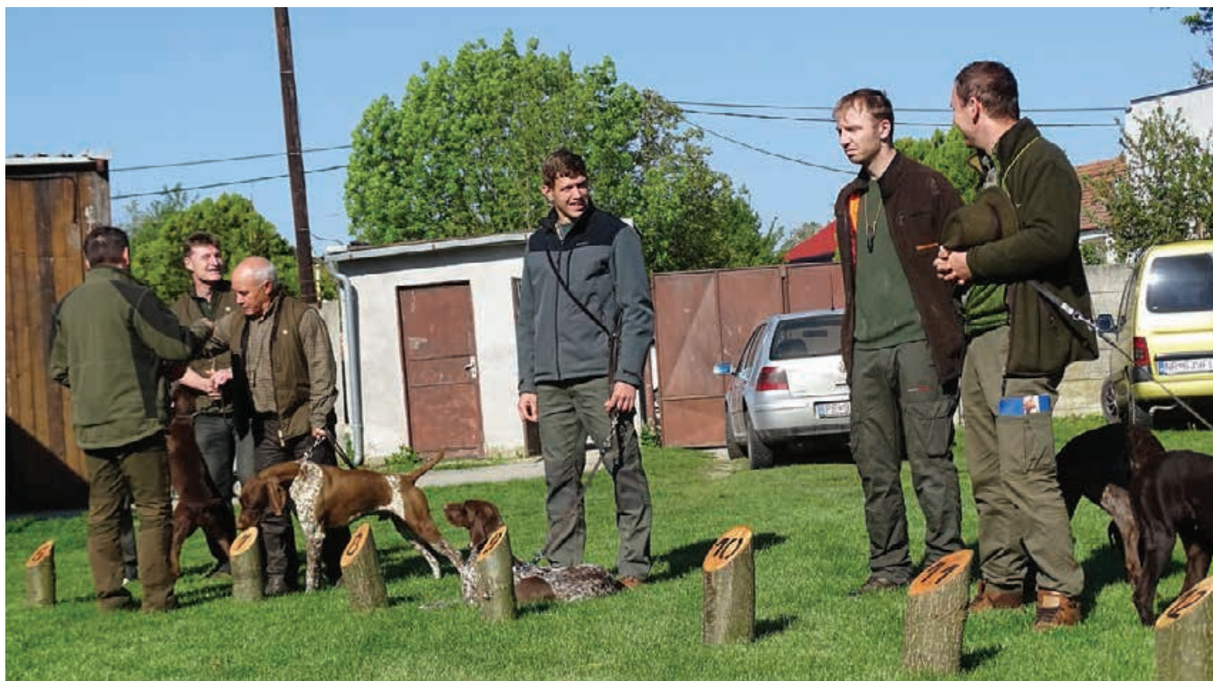
JSV - 2017