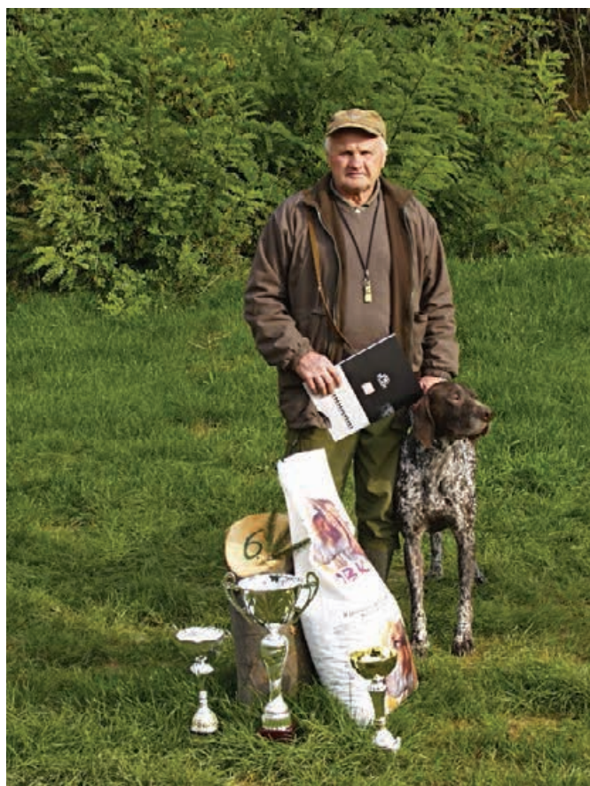
2013 - Jas z Dubovských luhov, v. J. Kolenič