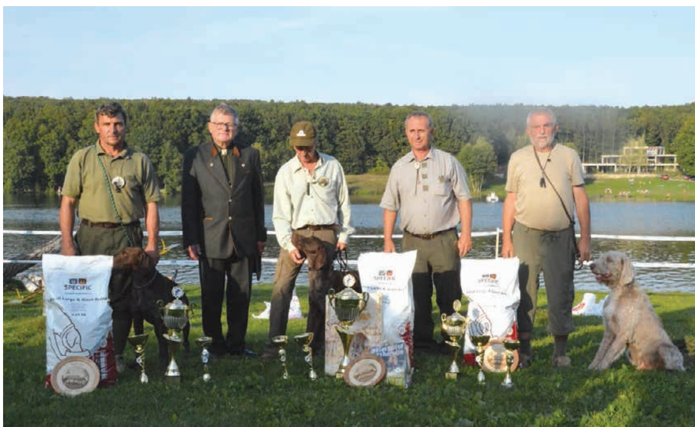
2016 - MJK Topoľčany - Duchonka