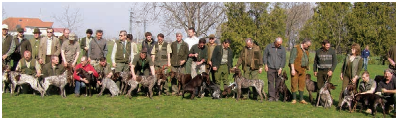
Jarný zvod 2009