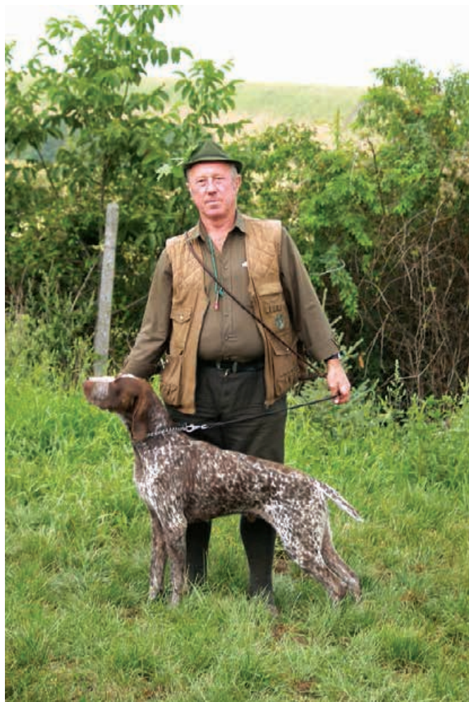
2007 - Aros z Fančali, v. M. Korič