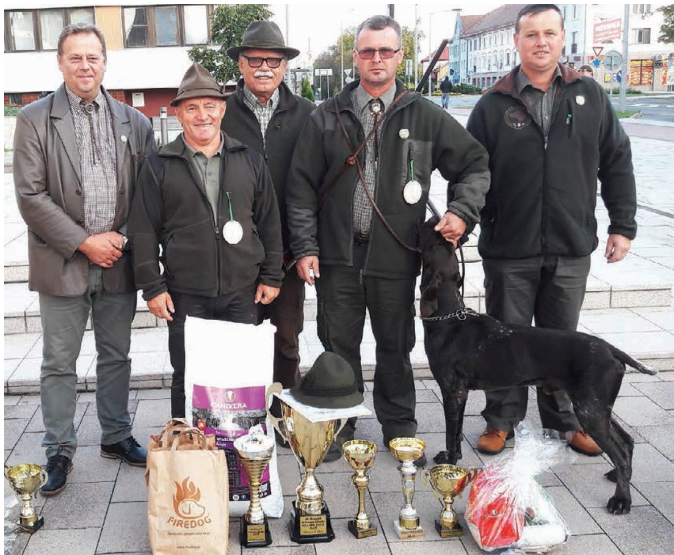
2016 - MKS Vranov n Toplou,