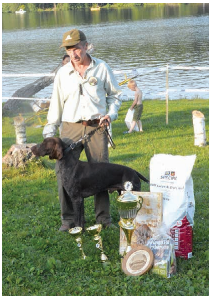
2016 Cyro spod Agátov, v. L. Banás st.