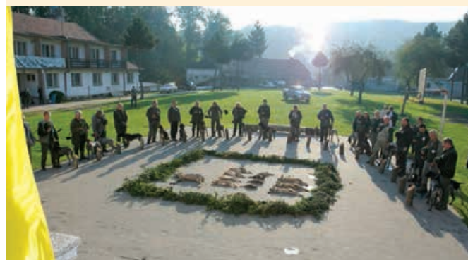
DP 2007 nástup