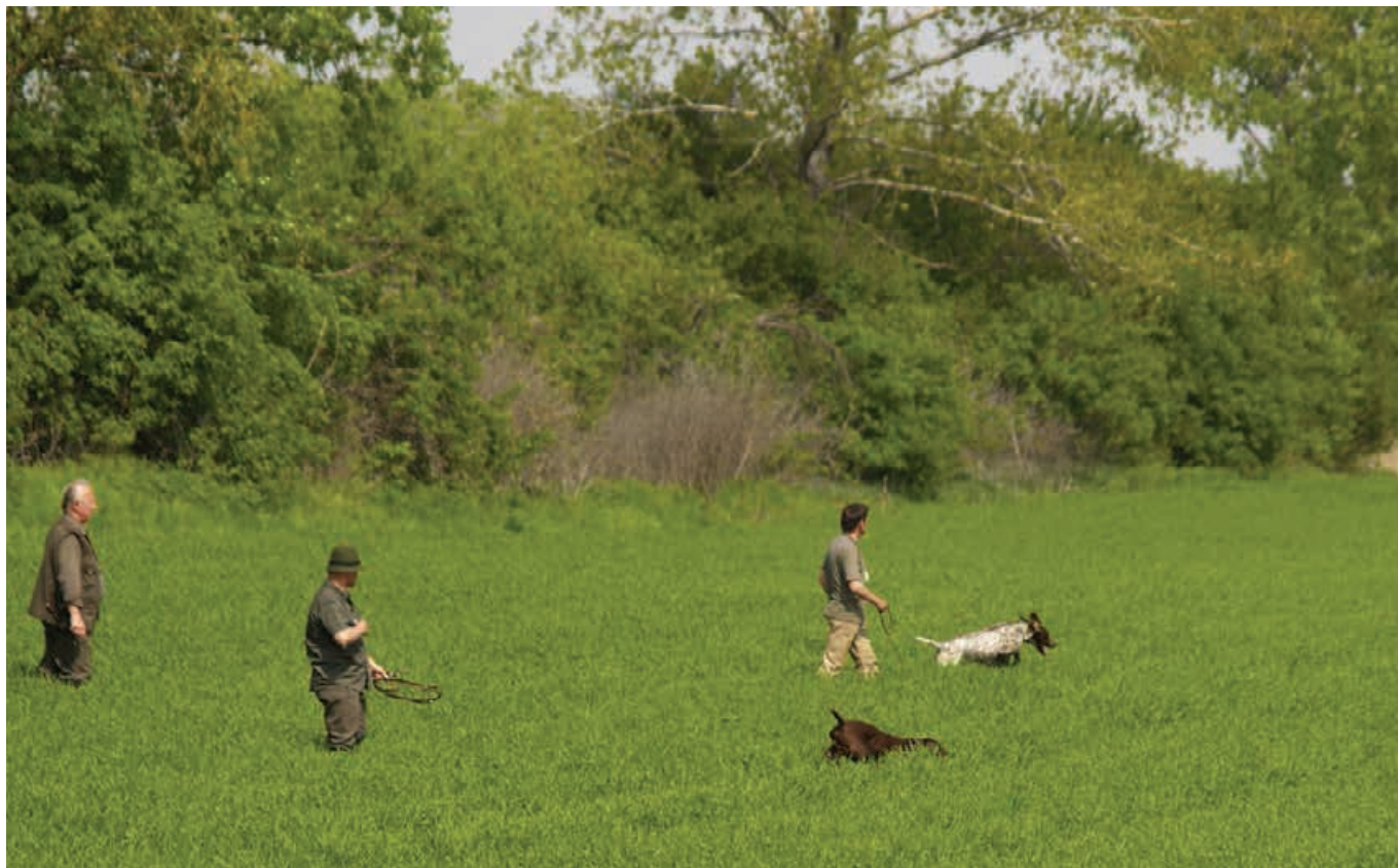
JSV - 2010