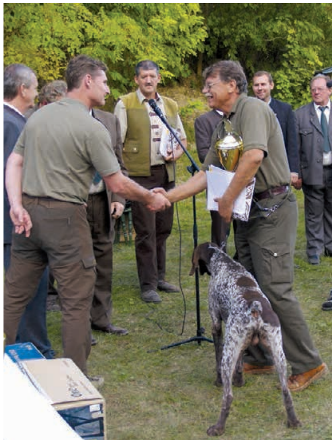
2009 - MKS - Mojmírovce