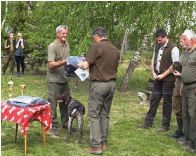
JSV - 2012