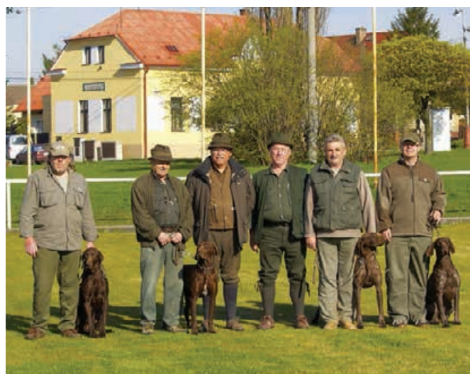
MS NKS - 2008 Neprevázka - ČR