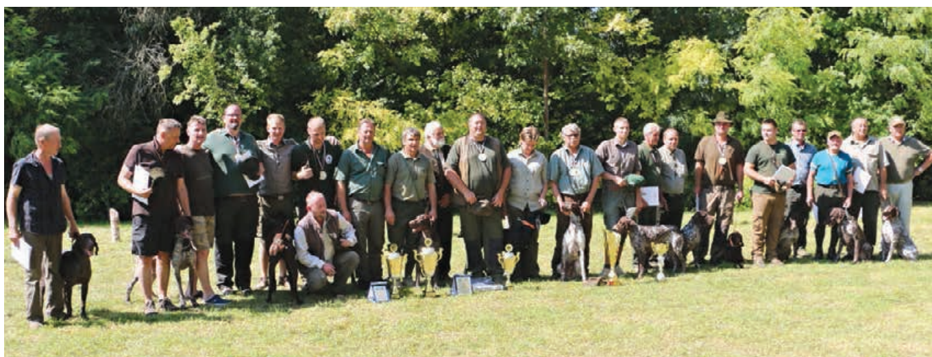
Pole - voda - 2016- záverečná fot.