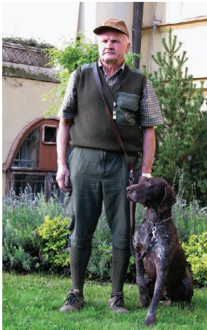
2009 - MJK Hronovce