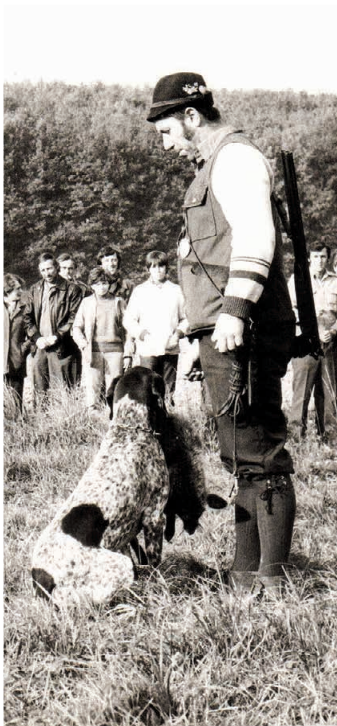
Ibis z Bilice