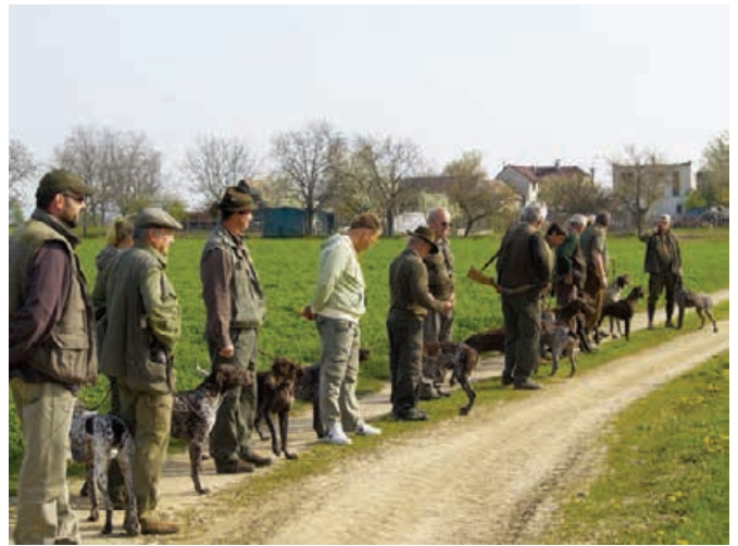
FT - 2010 - Dolné Dubové