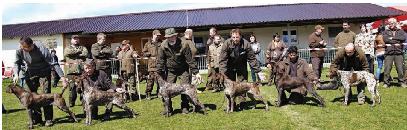
Jarný zvod 2013 - Dlhá nad Váhom