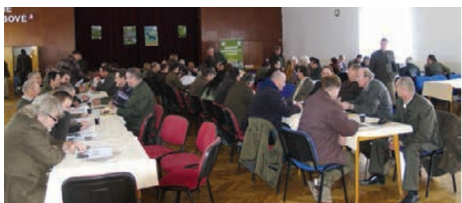
VČS - 2012