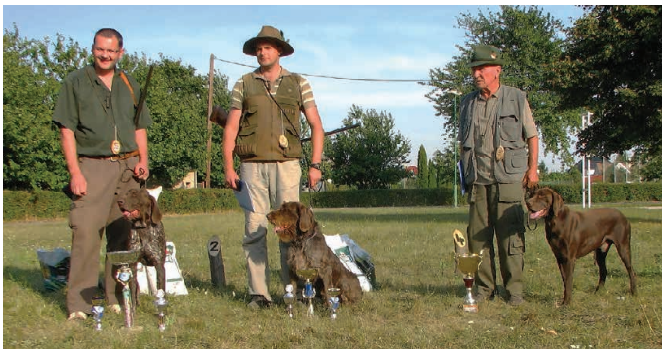
2011 - MJK Bernolákovo