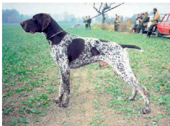
1996 - Ziko z Bilice