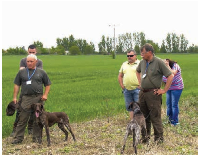
JSV - 2013