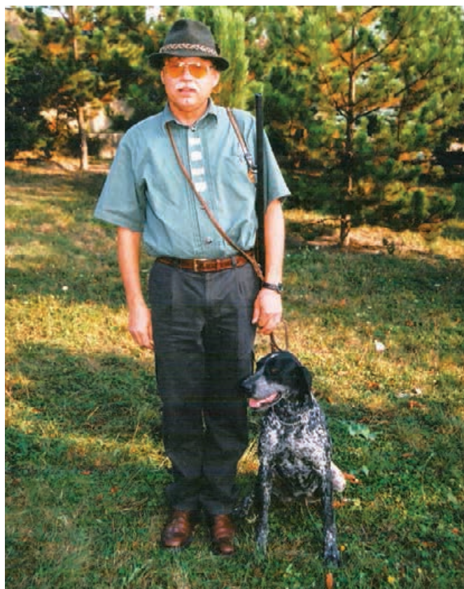
2000 Afra z Dubovských luhov v. J. Jursa