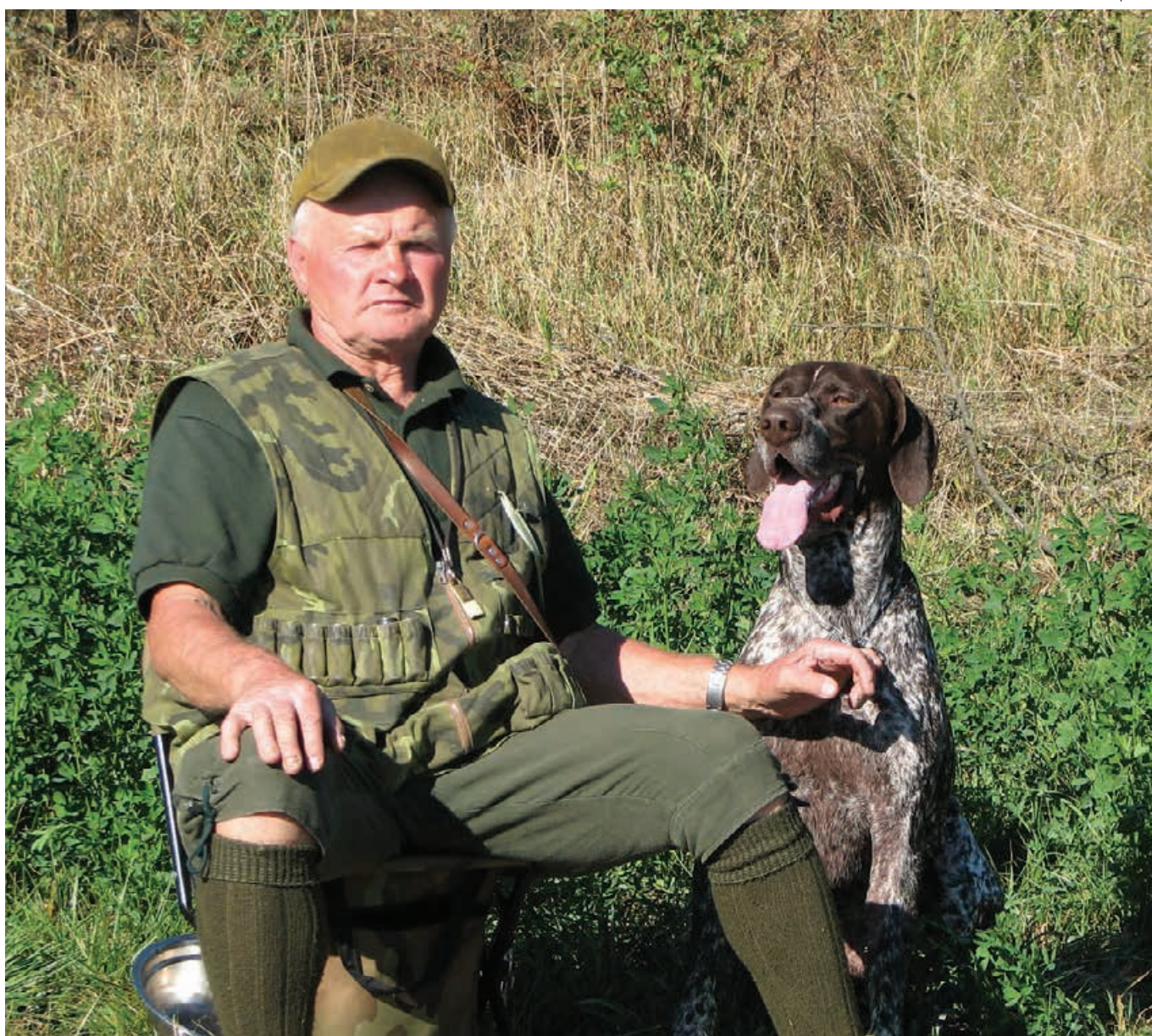
2013 - MJK - Vranov nad Topľou