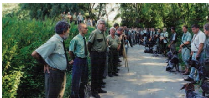
Súťaž- Pole - voda - 2003