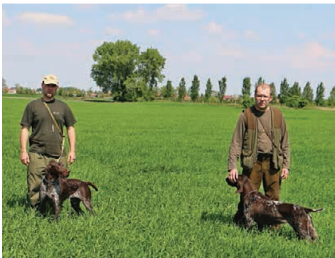
JSV - 2014