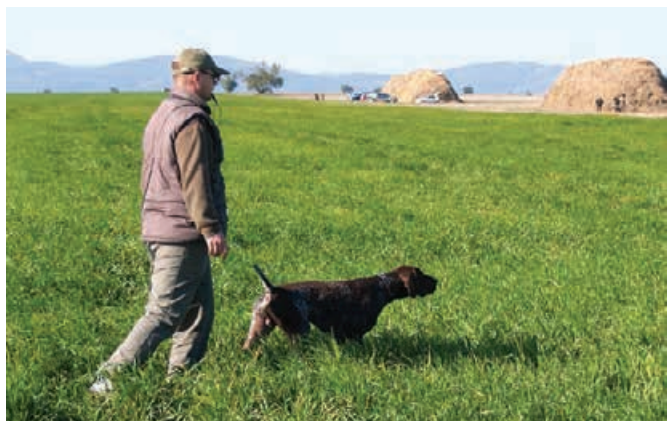
CHS NKS 2007 - Nikar z Bilice