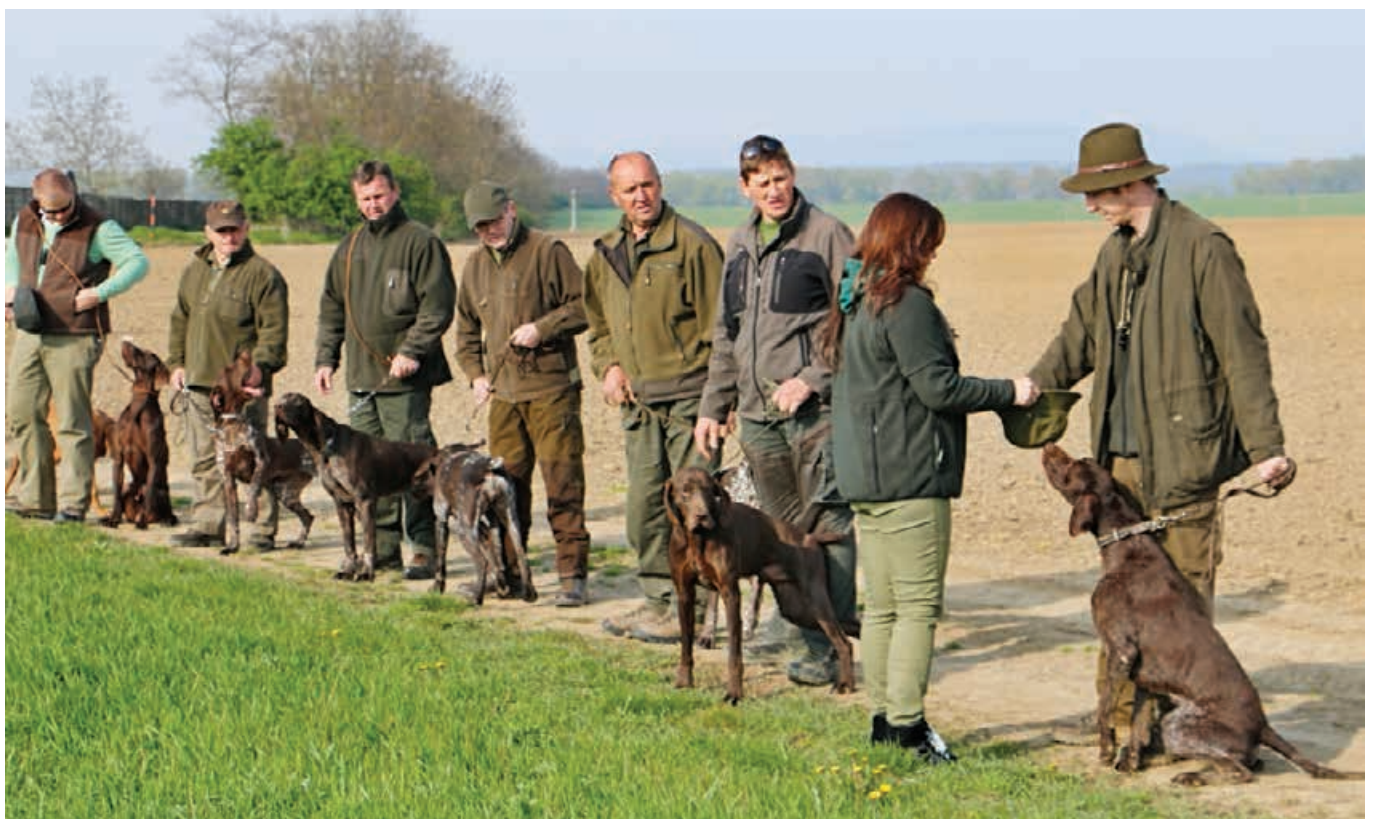
FT - 2014 - D. Dubové