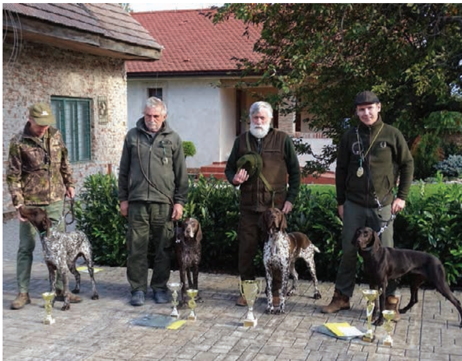
CHS NKS - 2017- najlepší psi.