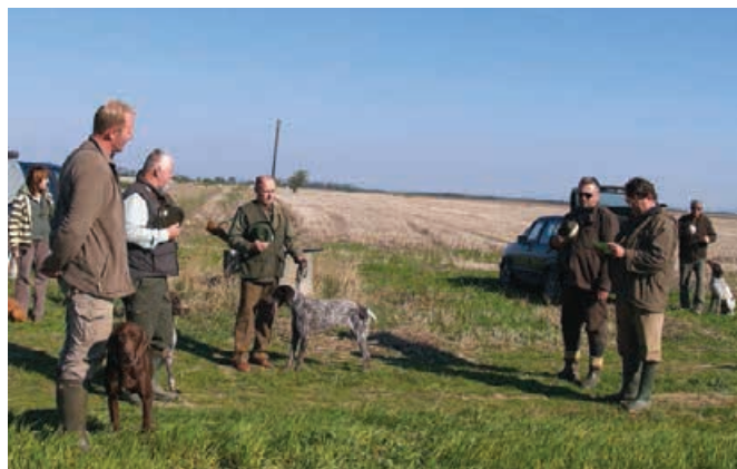
CHS NKS 2007 - rozh. - práca v poli