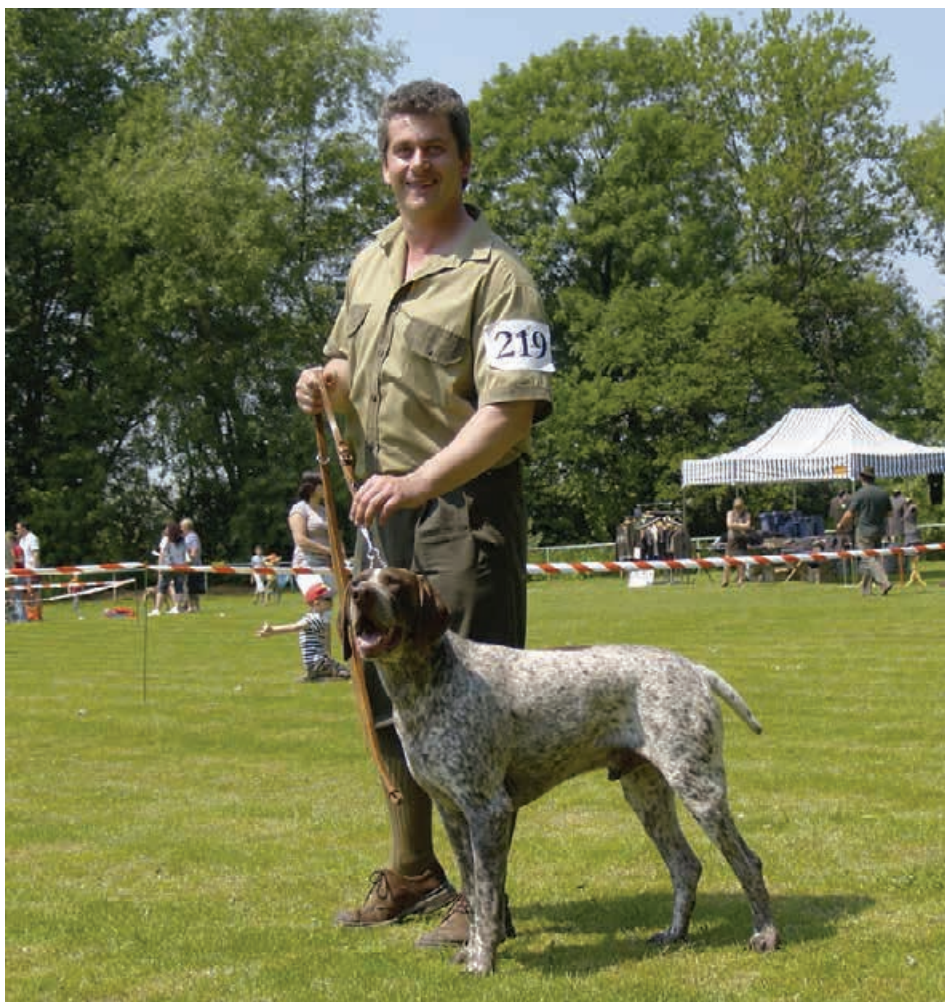
KV 2011 - Jero z Foláša - BOB