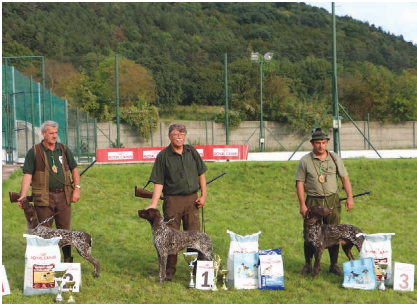
2014 - MJK Plavecké Podhradie