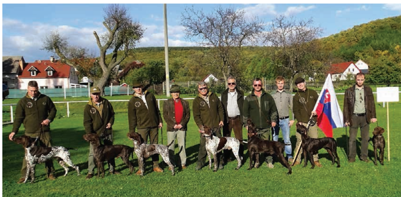
Účastníci DP 2017 zo Slovenska