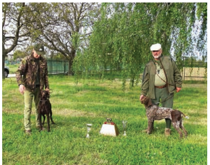
JSV - 2016