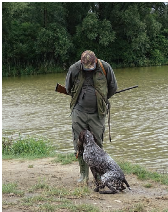
2016 - Mera z Kurucovho dvora odovzdáva kačicu vodičovi.