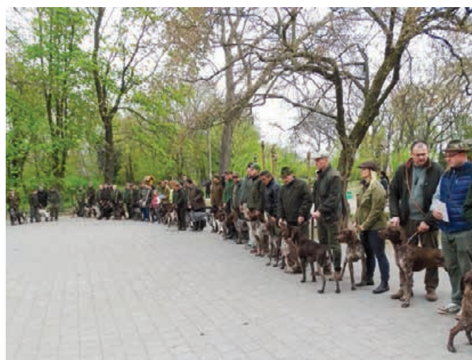
Jarný zvod NKS 2017 – Trnava