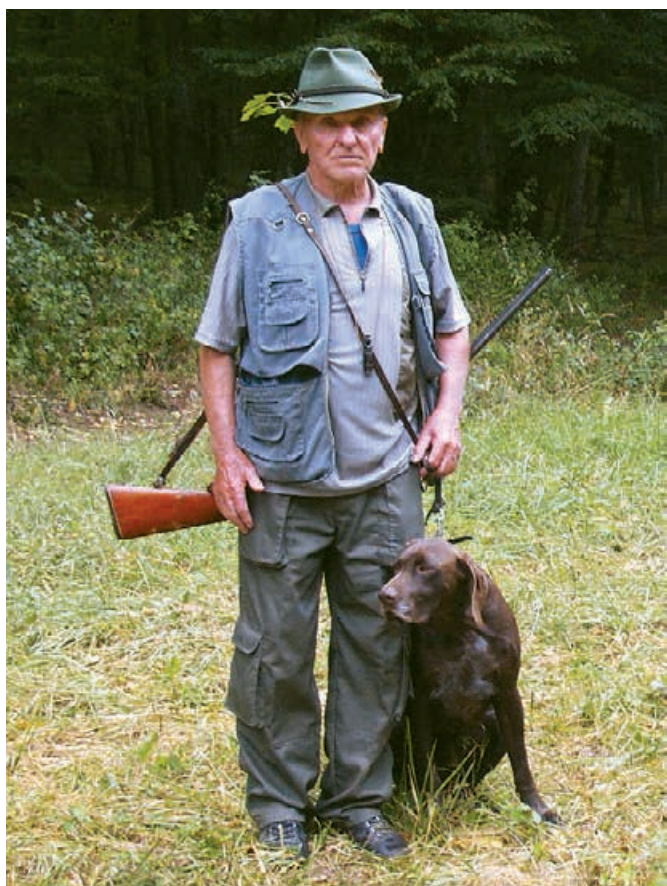
2012 Brit zo Šurianskeho kopca, v. O. Banás st.