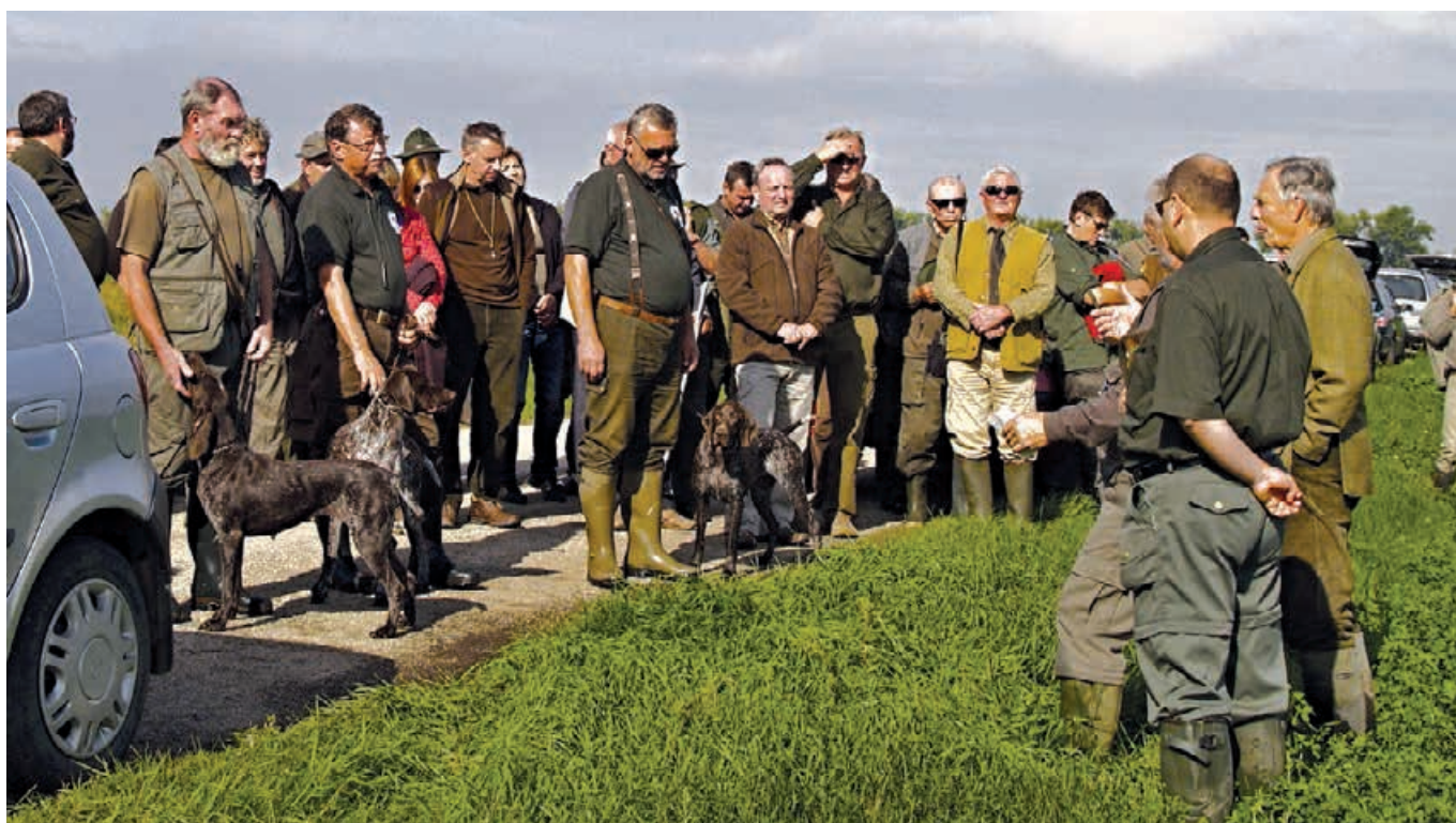
Vyhlasovanie výsledkov baráže - Medz. skúšky pole - voda 2013