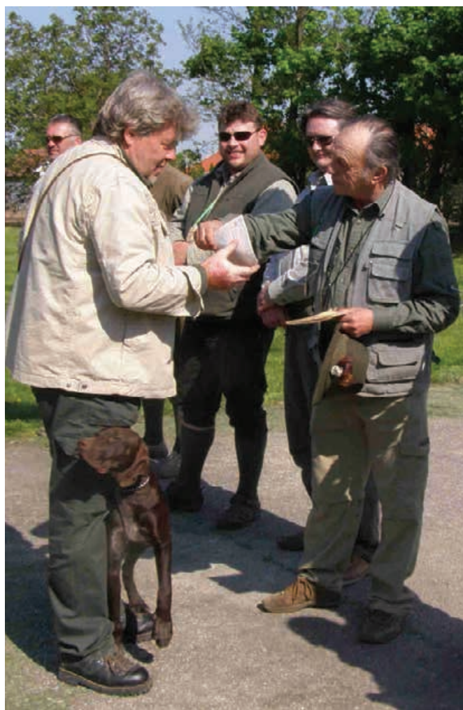
JSV - 2009 - Vítaz JSV Brita zo Šurianskeho kopca