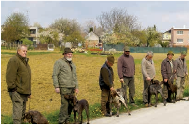
FT - 2012 Dolné Dubové