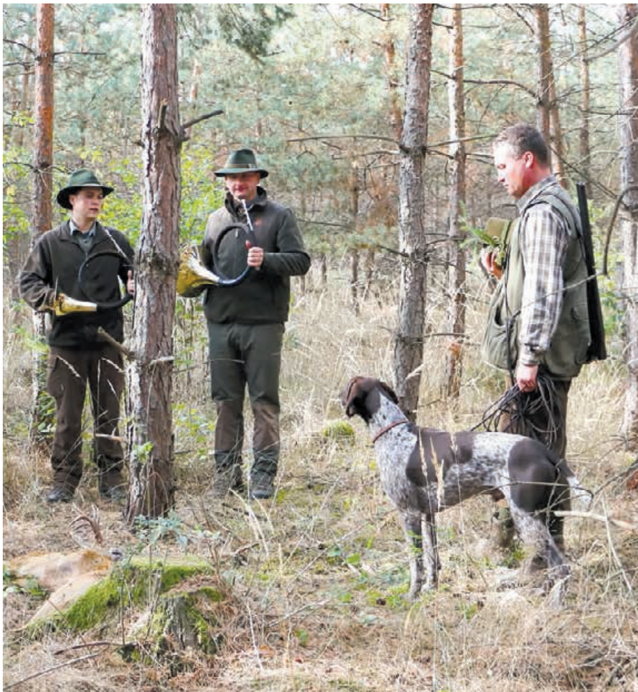
2015 Viko z Bilice, v. J. Debrovský