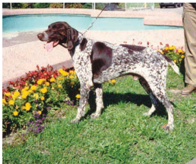
1994 - Unkas z Bilice