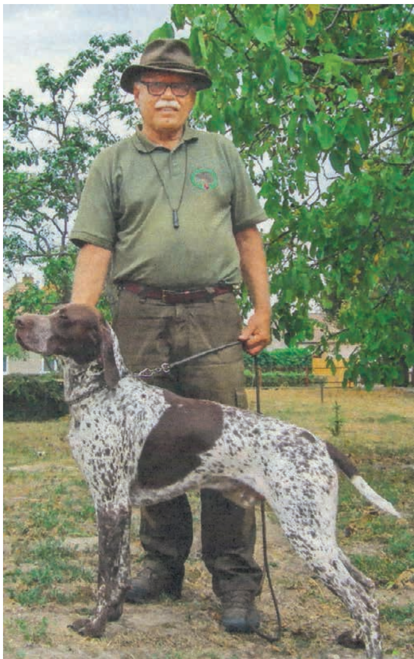
2017 - MKJ Blatné (PaR 11.2017)