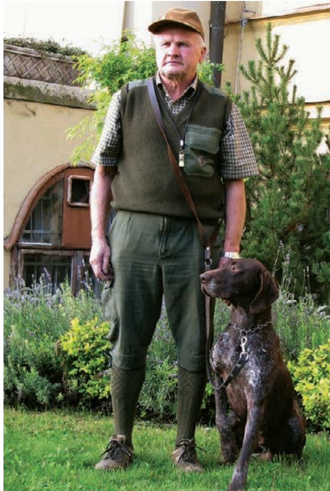
2009 Ringo z Potónskej lúky, v. J. Kolenič