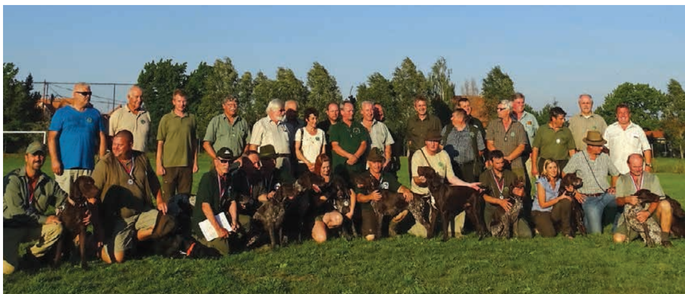
Spoločná fotografia na záver DP 2015 - Pata