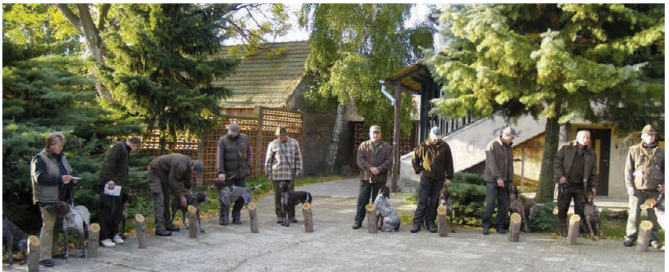
CHS NKS 2011 - Ružindol