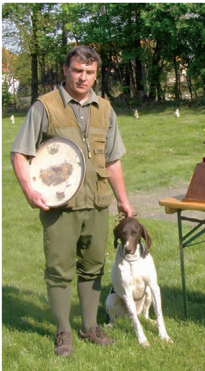
JSV - 2009 - jarný víťaz - Art z Dvorč. potoka