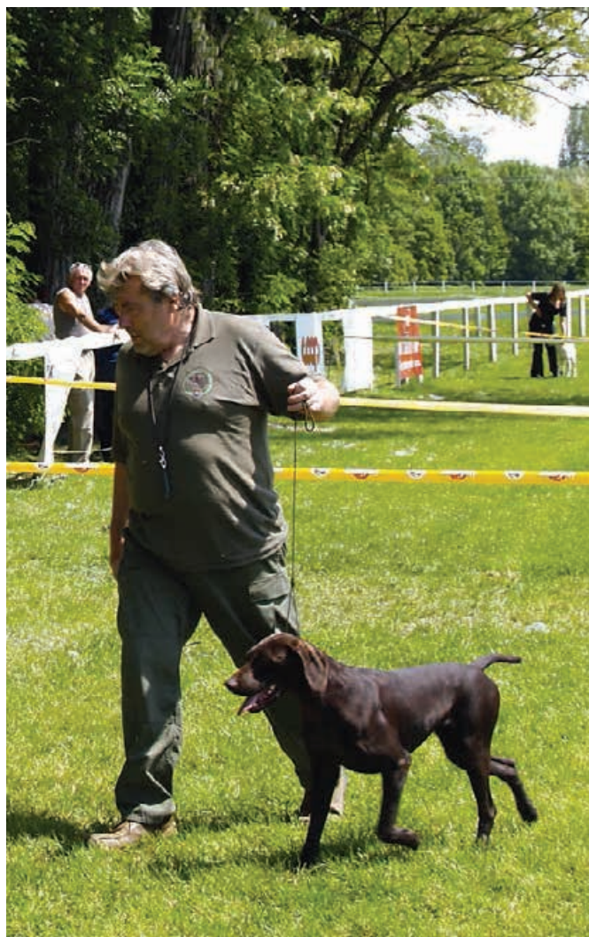
2011 Basty zo Šurianskeho kopca, v. O. Banás ml.