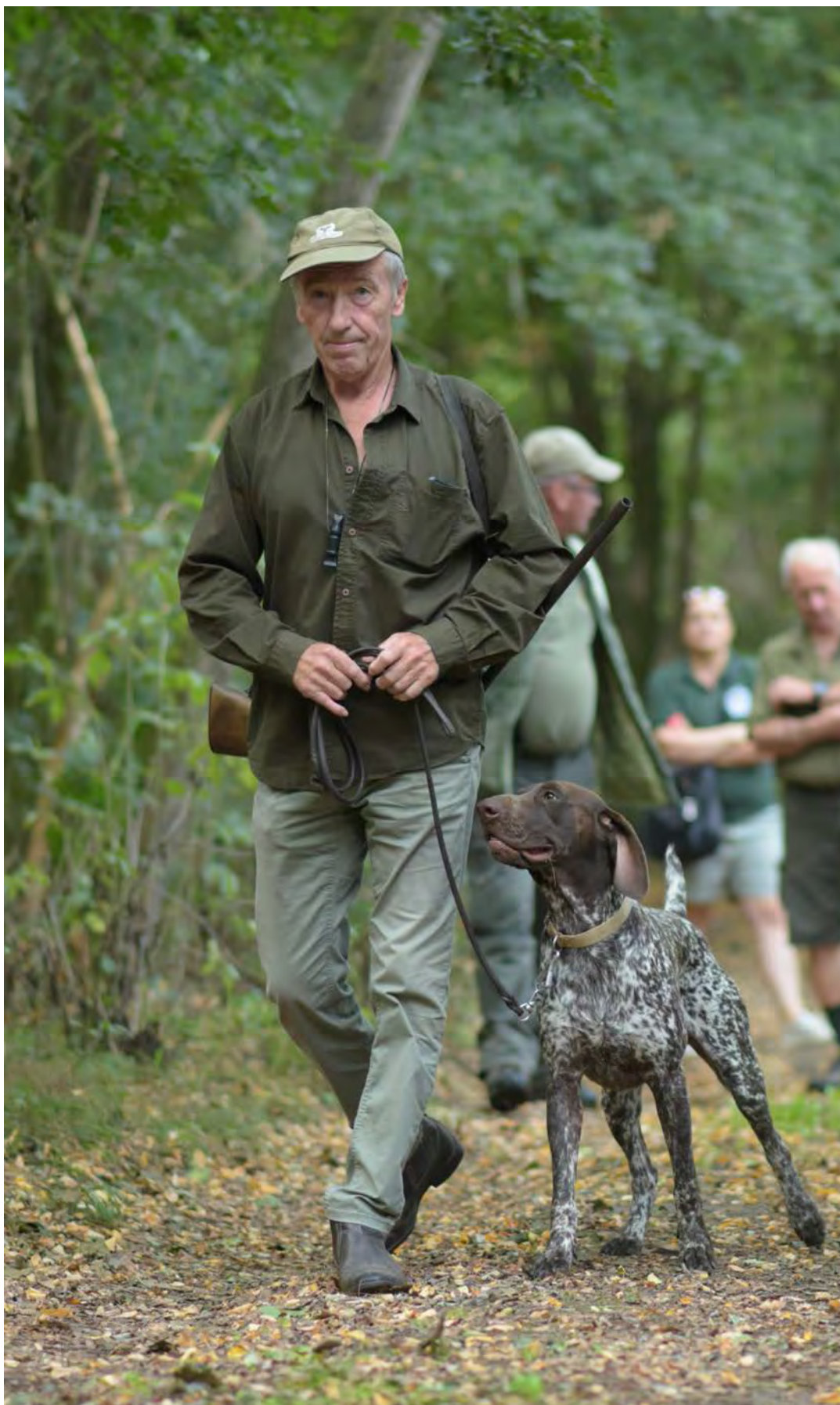
Cvik z Banášovho dvora