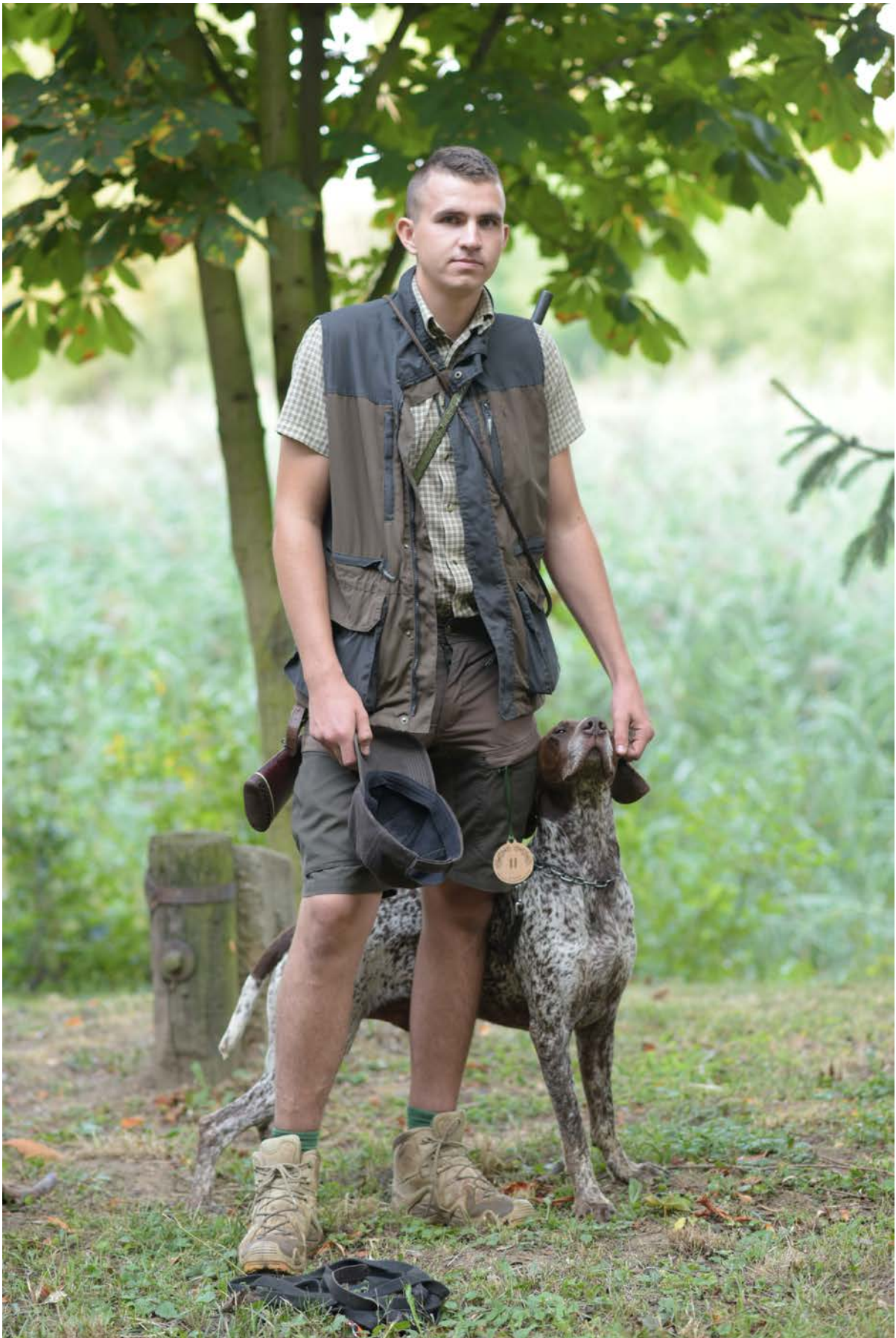
Azor z Pečejadských rovín